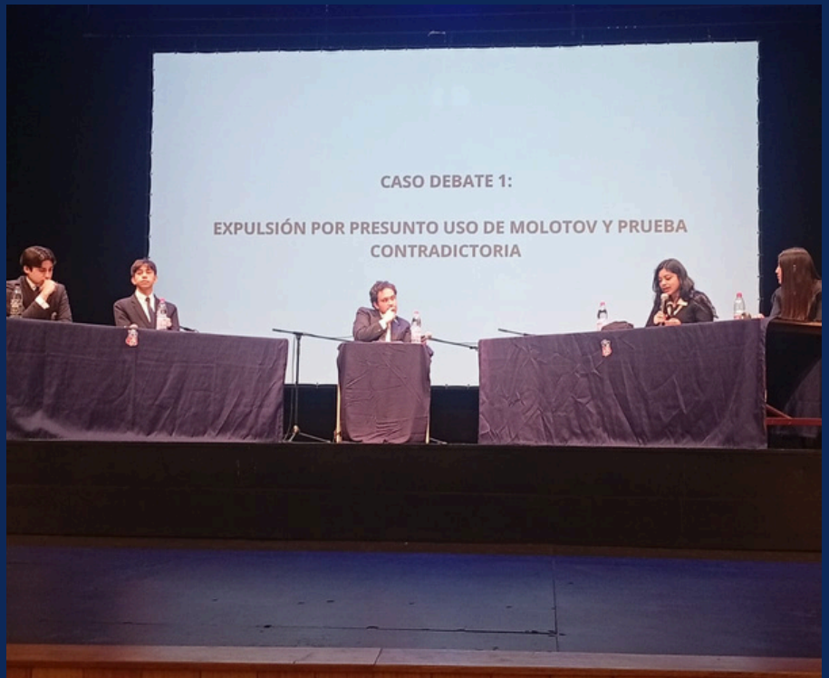
CONGRESO DE CONVIVENCIA EDUCATIVA 2026, CEINA.

El CEAIN presente en el 124° aniversario del Internado Nacional Barros Arana.